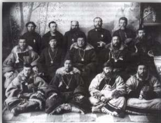
Фотография родовых зайсанов

- Давайте нарисуем иллюстрацию к сказке «Ячменное зерно» и в ней отразим все знания об условиях жизни и быта алтайского и русского народов.