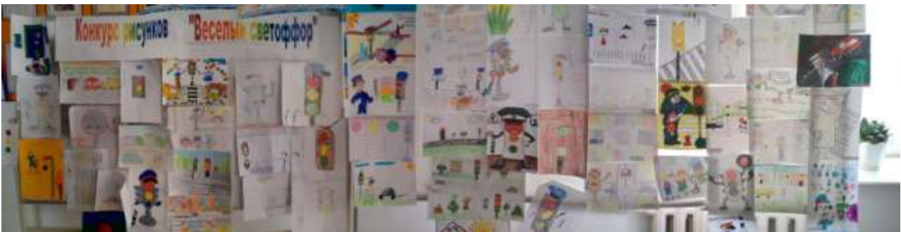
Конкурс рисунков «Веселый светофор», 2020