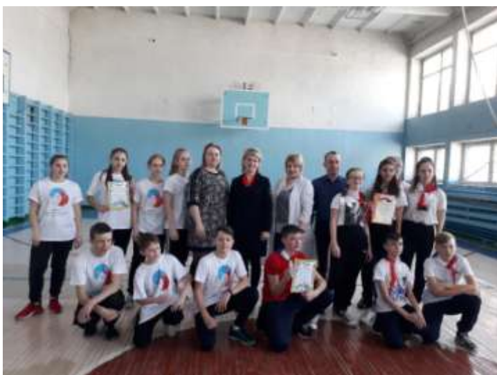
Конкурс команд ЮИД – команды СОШ № 15 и Лицея № 17