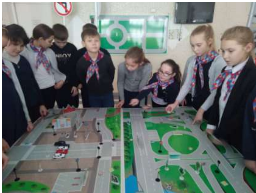
Практическое занятие с учащимися 5а класса, 2020г.

Для ребят постарше педагог-организатор проводит практические занятия, используя учебные настенные и настольные стенды-макеты. Ребята разбирают различные ситуации, которые могут возникнуть во время перехода дорог и перекрестков. Так учащиеся 6 класса с увлечением разбирают очередную проблемную ситуацию, которую им предложил педагог: