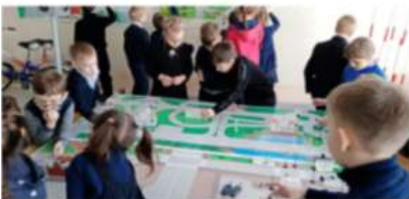
Идет очередное занятие в учебном центре «Мобильная площадка», 2021