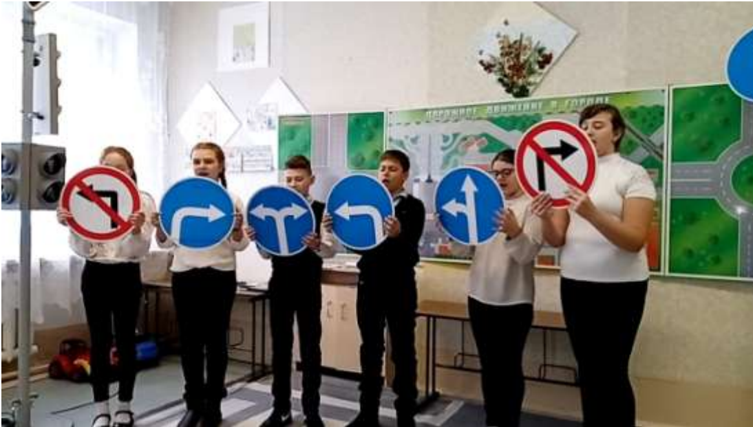
Отряд ЮИД «Перекресток» готовится к городскому смотру-конкурсу отрядов ЮИД, 2021г